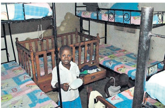
Neun Kinder teilen sich die Betten in dem kleinen Zimmer (links) im „Mighty Redeemer“-Waisenhaus. Täglich gibt es Maisbrei und Spinat (rechts). Mehr kann sich die Hausmutter nicht leisten.